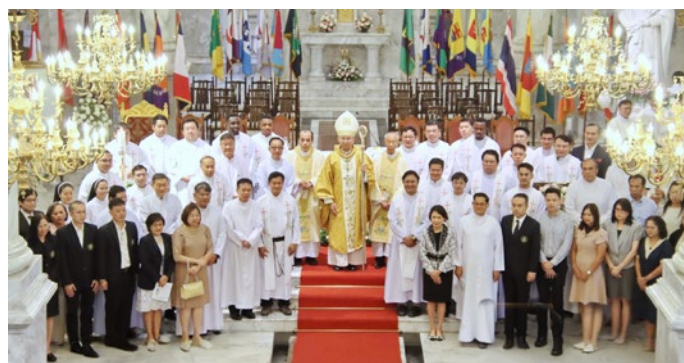
Le prêtre, les frères, les sœurs et les administrateurs d'Au ont participé à la cérémonie pour célébrer la chapelle Montfort.

« D'un siècle renommé à un siècle glorieux » était le thème du séminaire annuel destiné aux