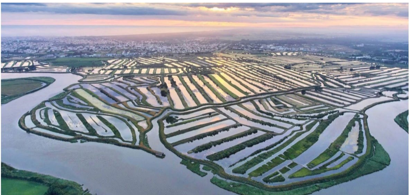
Le marais breton vendéen, région natale du F. René !