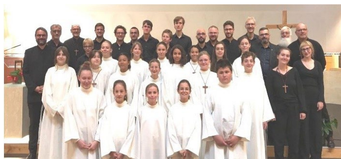
Le chœur en tenue liturgique.

Nous avons appris à nous connaître et à nous apprécier et quelle ne fut pas ma surprise de le voir arriver à la communauté pour me proposer de devenir aumônier du chœur d'enfants qu'il avait créé au sein du collège de la Cathédrale La Salle. Après réflexion et beaucoup d'hésitation, j'ai accepté et j'ai commencé ma mission en septembre 1994.