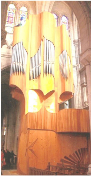
Le Grand Orgue de l'église Notre-Dame à Challans