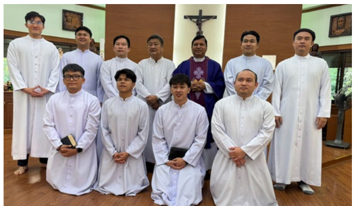
Les frères ont renouvelé leurs vœux cette année.