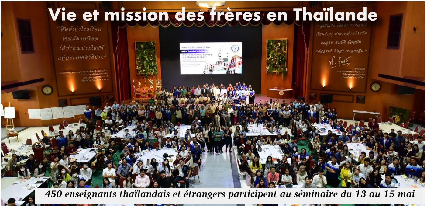
450 enseignants thaïlandais et étrangers participent au séminaire du 13 au 15 mai