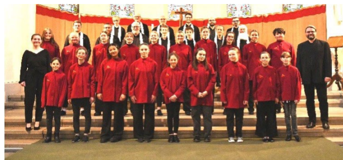
Le chœur en tenue de concert.