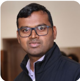
F. Louis A. Communication