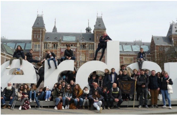
Photos de la tournée au Pays-Bas