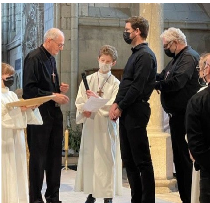
Présentation de la Croix des jeunes chanteurs

Voilà trois ans que j'ai transmis ma mission à un adulte laïc engagé mais je continue à chanter dans ce chœur qui fait désormais partie de moi-même.