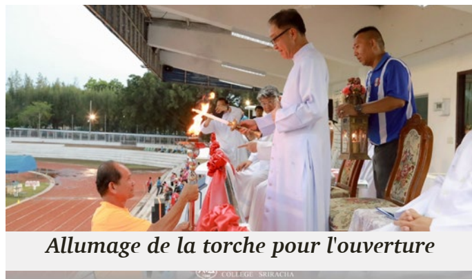
Allumage de la torche pour l'ouverture